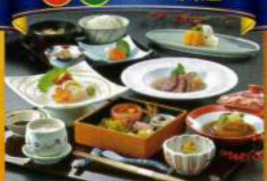
ホテル華の湯夕食