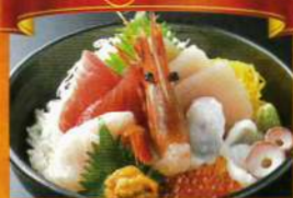
気仙沼の海鮮料理